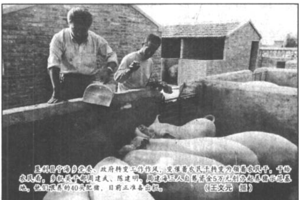
市医院举办十五大文件知识竞赛

本报讯 在最近召开的山东省依法行政规范化试点经验交流会上，东营区环保局向大会介绍了在依法行政方面所取得的成绩和经验，得到了省环保局领导的充分肯定和与会同行们的高度评价。 今年以来，这个区环保局创造性地提出了“横向到边，纵向到底，力度到顶”的三到原则和环境执法五大战略，并着力实施。与1995年同期相比，1997年1至10月份的排污申报率达到了96.7%，上升了近30%，排污费征收额增长了110%，监督管理面也拓宽了2倍多。同时，执法准确度显著提高，全局未出现执法错案及行政复议、诉讼案件。（李新军）